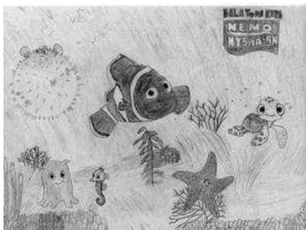
Balatoni Kitti 8.c

Elbírálás: a tantestület tagjaiból alakult zsűri